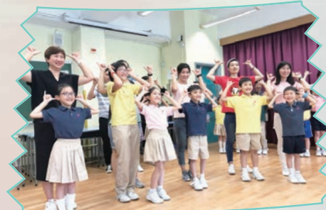
透過親子活動，促進「家校社」合作、幫助學生連繫社群。