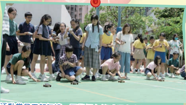
活動當日天朗氣清，同學們在籃球場上盡情享受測試太陽能車的樂趣。