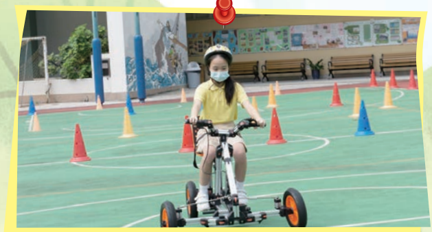
此電動車由STEM資優組的同學製作而成，高年級的同學透過電動車試行體驗活動，分享STEM資優組同學的學習成果。