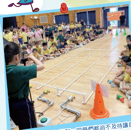
氣動賽車現場氣氛熱烈，同學們都迫不及待讓自已製作的氣動車上場作賽。