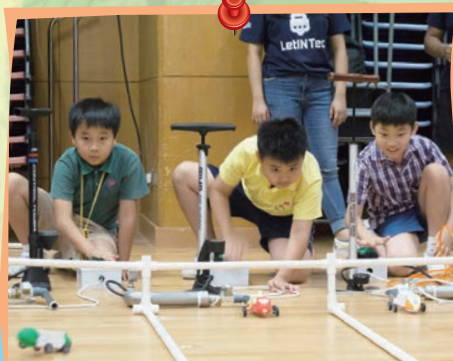
氣動賽車比賽緊張刺激，選手們都認真投入，渴望親手製作的氣動車能最快跨過終點。