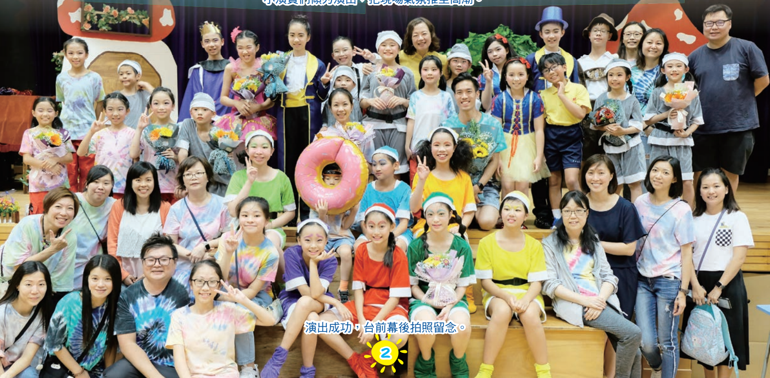
演出成功，台前幕後拍照留念。