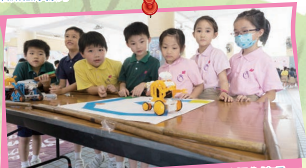
同學們全神貫注地學習「Tamiya robot」的操作技巧。