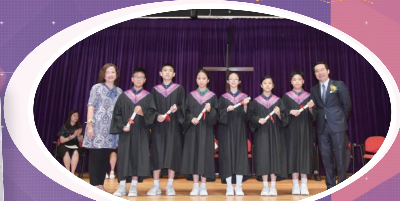
畢業生穿起畢業袍進行授憑儀式，準備迎接人生的新一頁。

第十七屆畢業典禮於七月六日完滿結束。除了頒獎和授憑儀式外，畢業生們還根據自己的喜好參與各項表演節目，包括英語歌舞、花式跳繩、演繹新編《木蘭辭》，以及大合唱。畢業典禮成為了讓畢業生們發光發亮的舞台，為他們的小學生涯畫上了一個完美的句號。