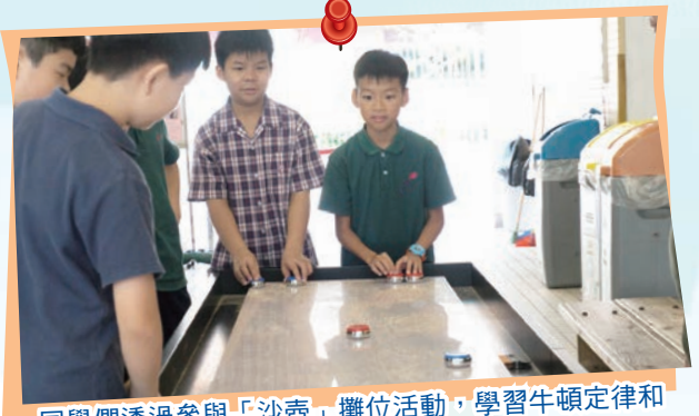
同學們透過參與「沙壺」攤位活動，學習牛頓定律和摩擦力等科學原理。