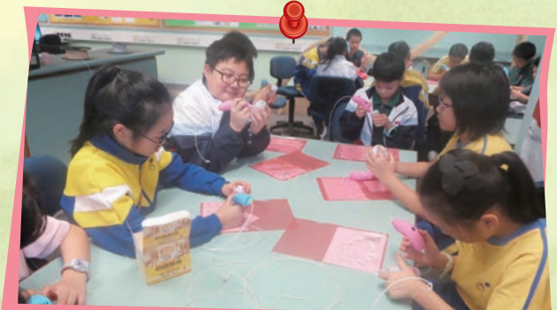
同學們用3D筆製作用具創意的3D作品。