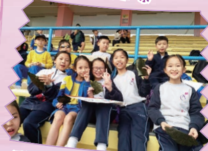
透過班際活動，幫助學生建立互相支持的關係。