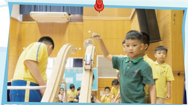
同學們把轆轤車放在長長的路軌上試行，然後根據測試結果再進行改良，務求達致完善。