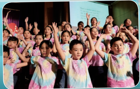
小演員們傾力演出，把現場氣氛推至高潮。