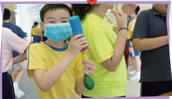
同學們透過參與「氣墊船」攤位活動，學習如何運用空氣減低摩擦力。