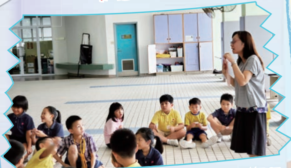
教師透過多元化的教學活動，提升學生的學習興趣。