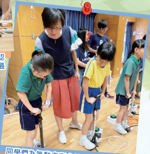
同學們為氣動車奮力地加氣，希望氣動車能走得更遠，爭取佳績。