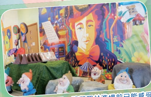
劇場外的精美佈置，讓觀眾於進場前已能感受到歡樂的氣氛。

經過一年的籌備和排演，本校音樂劇校隊的第三屆原創音樂劇《Wonka and the Chocolate Factory》於六月公演。合唱團團員和台前幕後的音樂劇校隊成員通力合作，施展渾身解數，讓演出取得空前成功。於表演開始前，觀眾在劇場外興奮地與「氣球拱門」和「小矮人村莊」等佈置拍照留念。音樂劇開幕後，觀眾們很快就被現場的氣氛所感染，沉醉在同學們精彩的演出和巧克力香味中，度過一個歡樂的晚上。