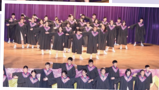
畢業生獻唱英語歌曲《Glad You Came》，載歌載舞，氣氛熱烈。