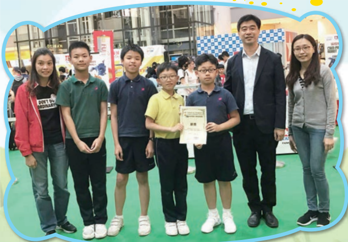
「Tamiya Robot Challenge 2019田宮機械人挑戰賽」銀獎