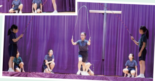
畢業生表演花式跳繩，精彩絕倫。