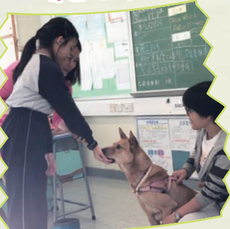
透過小組訓練及課堂教學，幫助學生建立正面情緒。