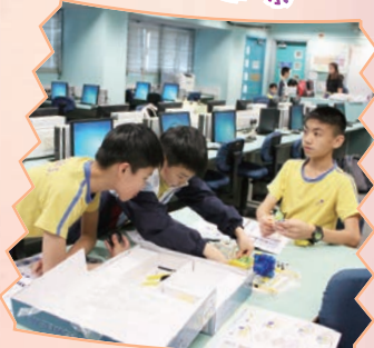
透過舉辦不同的活動，加強學生對學校的歸屬感。